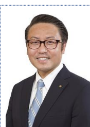
おおし けんご 長崎県知事 大石 賢吾

長崎北高、カリフォルニア大学デービス校卒業後、長崎大学熱帯医学研究所、千葉大学医学部付属病院、厚生労働省、日本医療研究開発機構を経て、2022年2月の知事選で初当選し、現在1期目。39歳。 「メンバーの皆さんとのミーティングを楽しみにしております。」